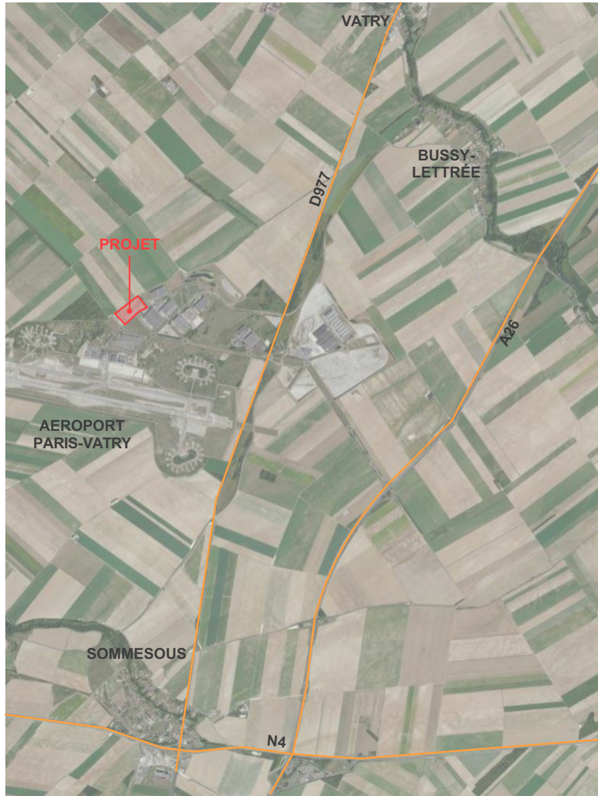
Plan de situation (1/50 000)